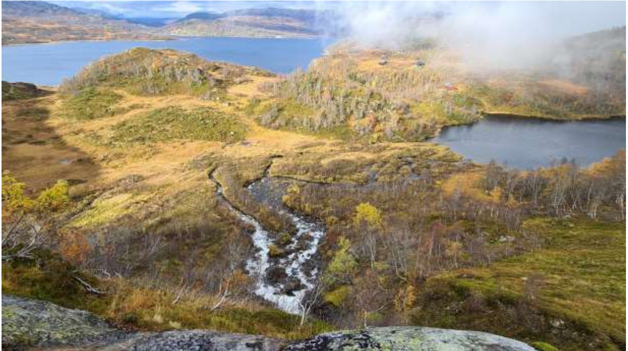
I) Flaumsletta ved Lomatjørn frå sør-aust (mykje større enn avmerka område på aktsemdskart, vedl. 3)