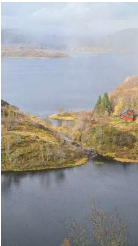
II) Elv frå Lomatjørn sett frå sør aust