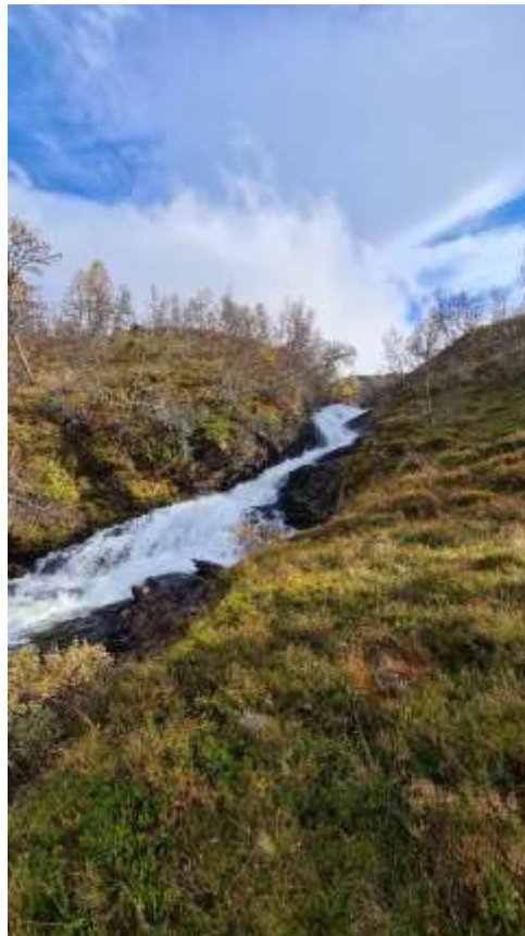
III) Elv frå Lomatjørn sett frå Svorteviki nord – vest